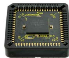
IC ソケットに搭載可能

AP68-01 は、ALTERA 社の高性能 CPLD である、MAX II を PLCC 68 ピンサイズに変換し、IC ソケットに実装を可能とした CPLD モジュールです。