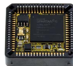
IC ソケットに搭載可能

XP68-03 は、XILINX 社の高性能 FPGA である、Spartan-6 を PLCC 68 ピンサイズに変換し、IC ソケットに実装を可能とした FPGA モジュールです。