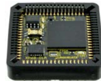
IC ソケットに搭載可能

XP68-01 は、XILINX 社の高性能 FPGA である、Spartan-6 を PLCC 68 ピンサイズに変換し、IC ソケットに実装を可能とした FPGA モジュールです。